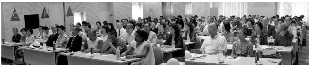
会場は全国から参加された会員で一杯になりました。